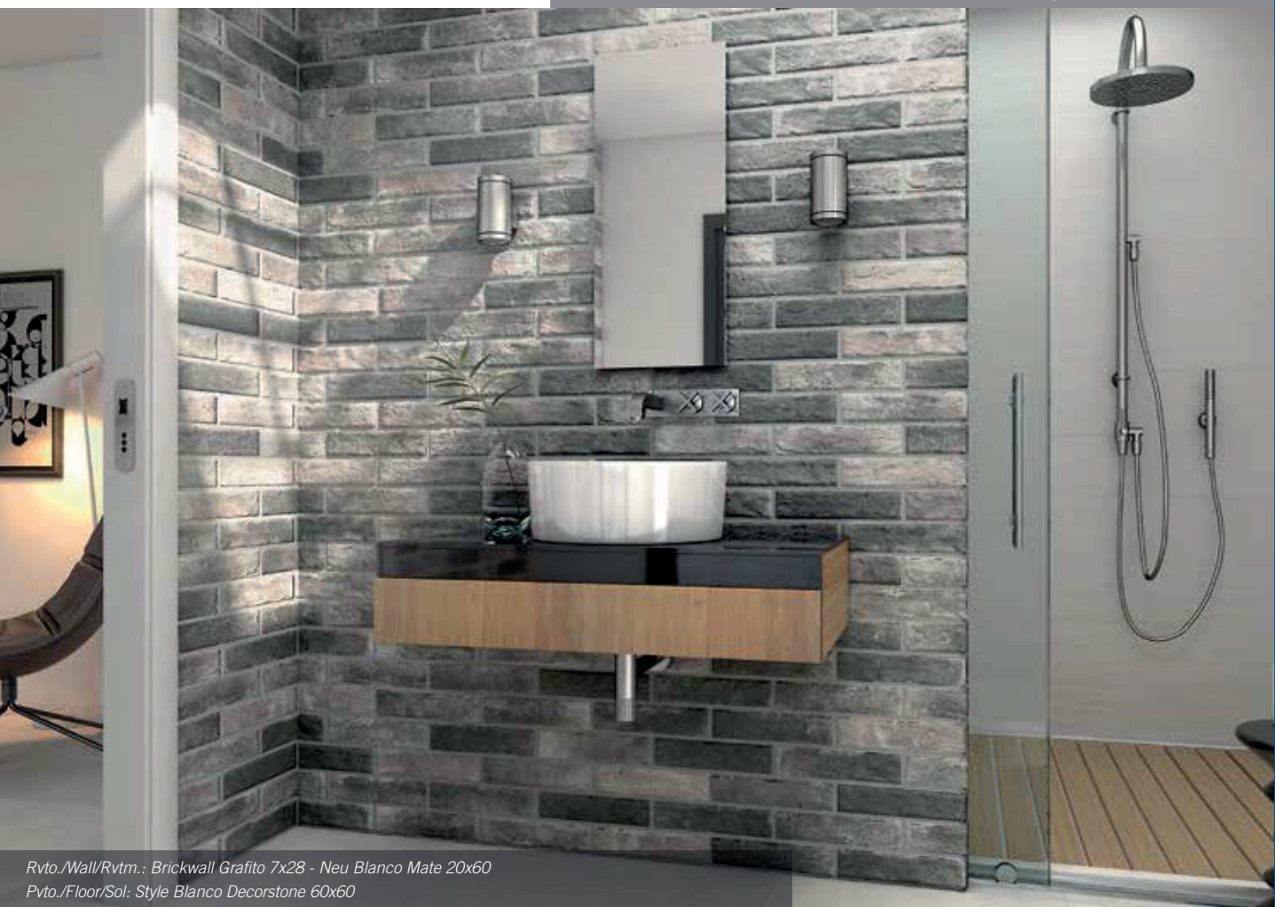
Rvto./Wall/Rvtm.: Brickwall Grafito 7x28 - Neu Blanco Mate 20x60 Pvto./Floor/Sol: Style Blanco Decorstone 60x60