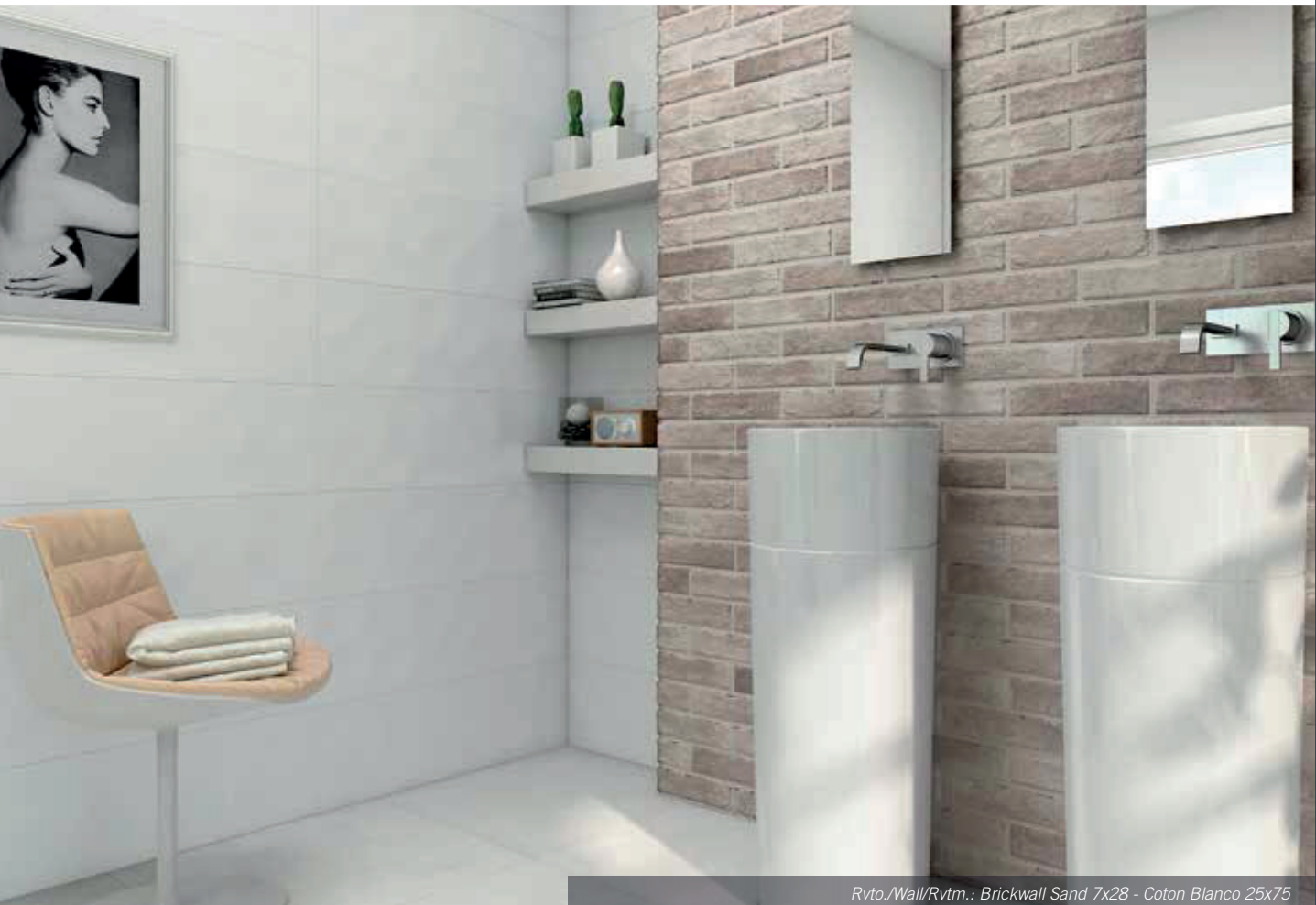
Rvto./Wall/Rvtm.: Brickwall Sand 7x28 - Coton Blanco 25x75 Pvto./Floor/Sol: Style Marfil Decorstone 60x60