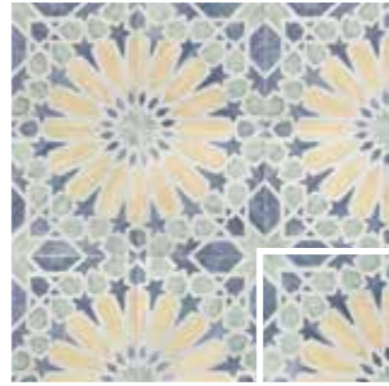
CARINO DECO MARLA 20x20 (M 280) 8"x8"