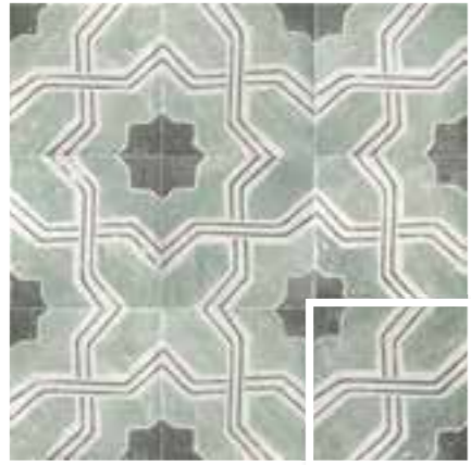
CARINO DECO IBERIA 20x20 (M 280) 8"x8"