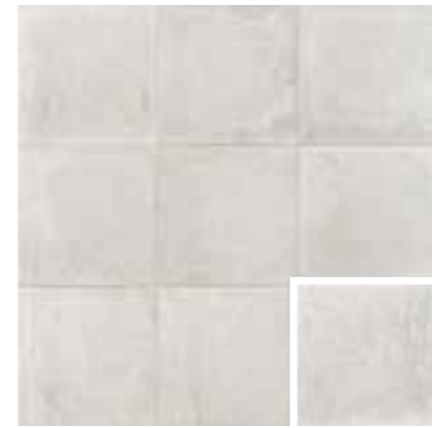
CARINO PERLA GRAY 20x20 (M 280) 8"x8"