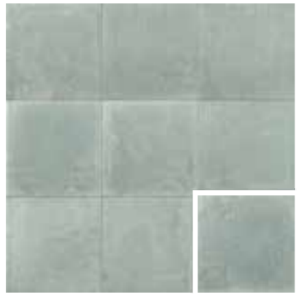
CARINO MENTA GREEN 20x20 (M 280) 8"x8"