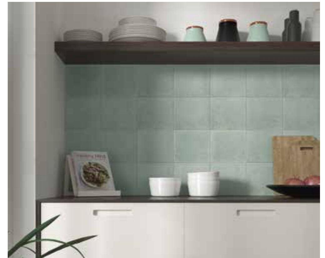
Carino Menta Green 20x20 · 8"x8"