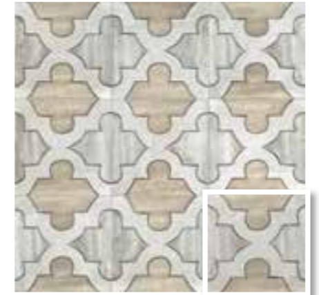
CARINO DECO PICOS 20x20 (M 280) 8"x8"