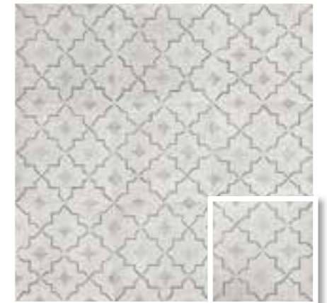
CARINO DECO COMO 20x20 (M 280) 8"x8"