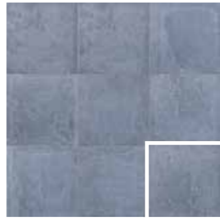
CARINO INDIGO 20x20 (M 280) 8"x8"