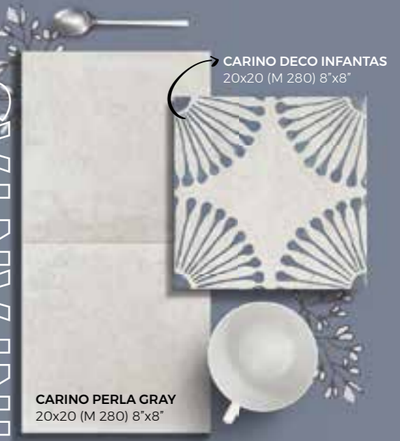
CARINO DECO INFANTAS 20x20 (M 280) 8"x8"