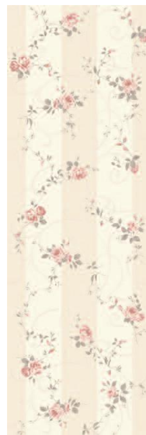
12067 Дейра Цветы 25x75 Deira Flowers