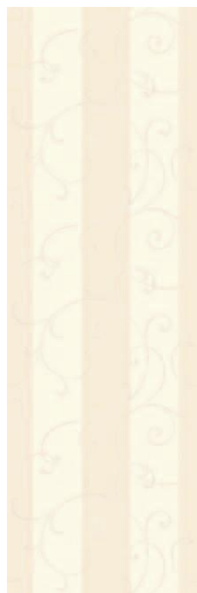
12066 Дейра светлый 25x75 Deira light