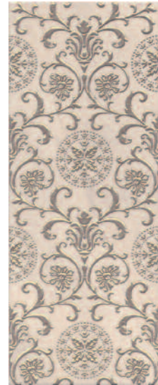
STG/A410/7154 Формиелло 20x50 Formiello