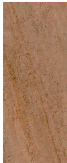
7156 Формиелло беж тёмный 20x50 Formiello dark beige