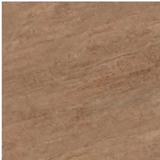
4610 Формиелло беж тёмный 50,2x50,2 Formiello dark beige