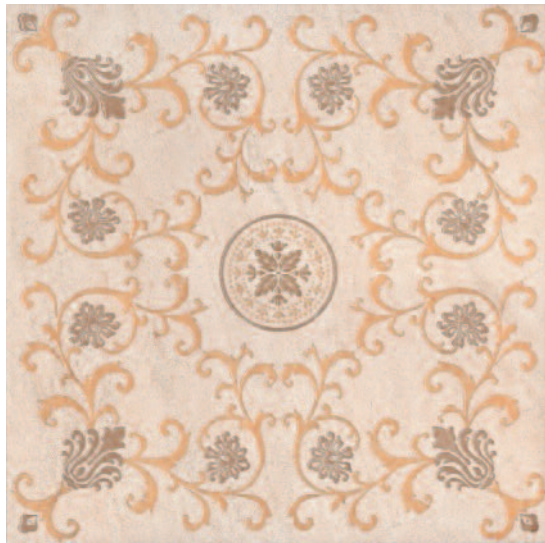
STG/A475/4609 Формиелло 50,2x50,2 Formiello