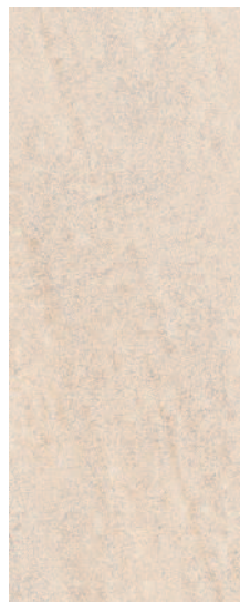
7154 Формиелло беж 20x50 Formiello beige