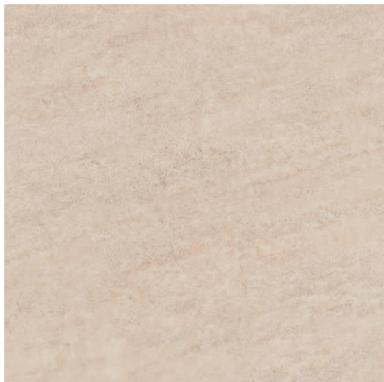
4609 Формиелло беж 50,2x50,2 Formiello beige