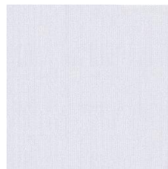
3427 Эйвон голубой 30,2x30,2 Avon blue