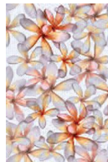
8243 Эйвон Цветы 20x30 Avon Flowers