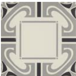
20x20 Dresda Grigio/Nero AHD65 - 133 MQ