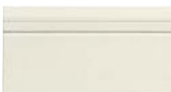
10x20 Zoccolo Dover OEZ1 - 105 PZ