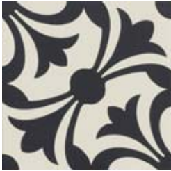
20x20 Lipsia Nero AHL5 - 134 MQ