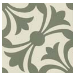
20x20 Lipsia Salvia AHL4 - 134 MQ