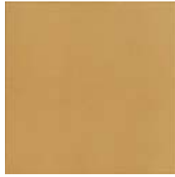
20x20 Leeds OE2 - 92 MQ