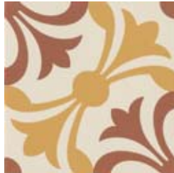
20x20 Lipsia Cotto/Ocra AHL23 - 133 MQ