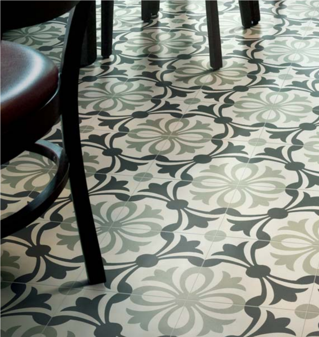
20x20 Lipsia Salvia/Nero