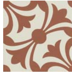
20x20 Lipsia Cotto AHL3 - 134 MQ