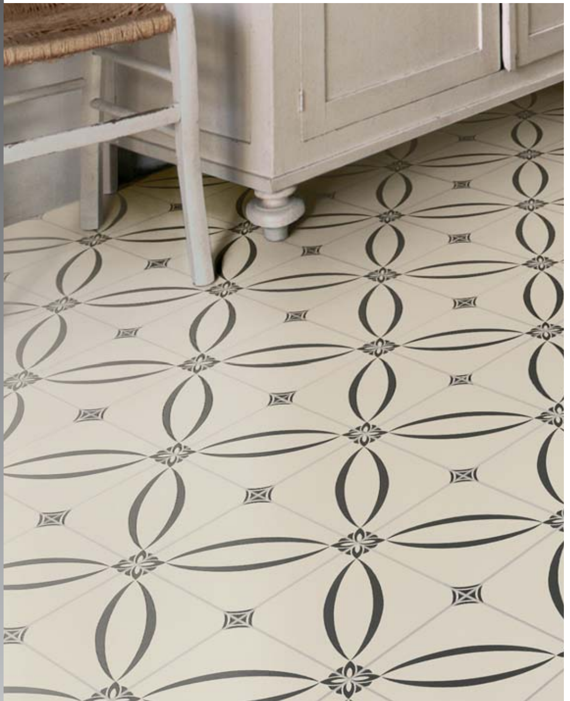
20x20 Berlino Nero 20x20 York