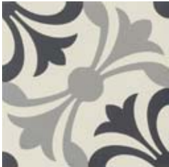
20x20 Lipsia Nero/Grigio AHL65 - 133 MQ