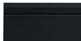
10x20 Zoccolo York OEZ5 - 105 PZ