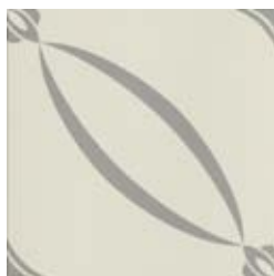
20x20 Berlino Grigio AHB6 - 134 MQ