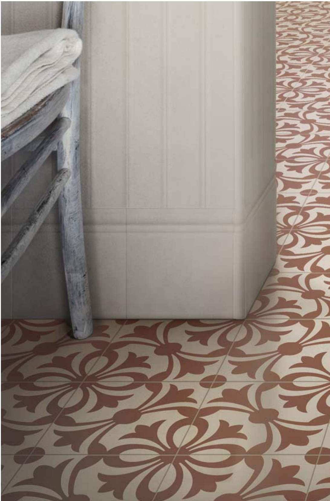
20x20 Lipsia Cotto 10x20 Zoccolo Chester Boiserie Finale - Zoccolo - Coprispoglo - Angoli Beige Matt