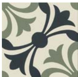
20x20 Lipsia Salvia/Nero AHL54 - 133 MQ