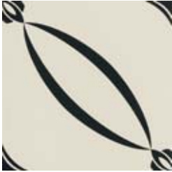
20x20 Berlino Nero AHB5 - 134 MQ