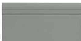
10x20 Zoccolo London OEZ6 - 105 PZ