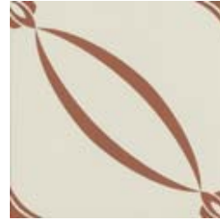
20x20 Berlino Cotto AHB3 - 134 MQ