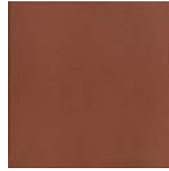
20x20 Chester OE3 - 92 MQ