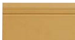
10x20 Zoccolo Leeds OEZ2 - 105 PZ