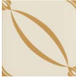
20x20 Berlino Ocra AHB2 - 134 MQ