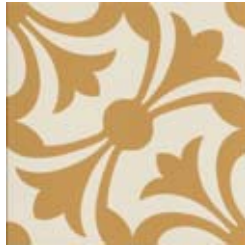
20x20 Lipsia Ocra AHL2 - 134 MQ