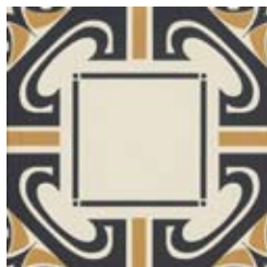
20x20 Dresda Nero/Ocra AHD52 - 133 MQ