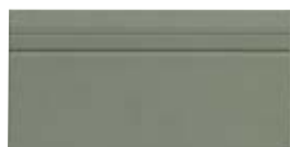
10x20 Zoccolo Bath OEZ4 - 105 PZ