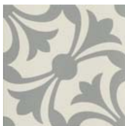
20x20 Lipsia Grigio AHL6 - 134 MQ