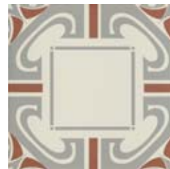
20x20 Dresda Grigio/Cotto AHD63 - 133 MQ