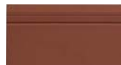
10x20 Zoccolo Chester OEZ3 - 105 PZ