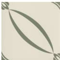
20x20 Berlino Salvia AHB4 - 134 MQ