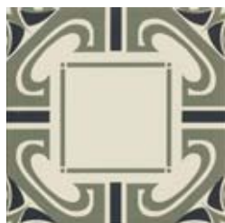
20x20 Dresda Salvia/Nero AHD45 - 133 MQ