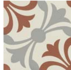
20x20 Lipsia Cotto/Grigio AHL63 - 133 MQ