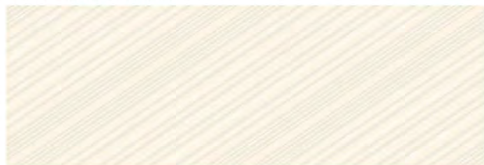
Ethereal DW15ERL11 Декор 250x750