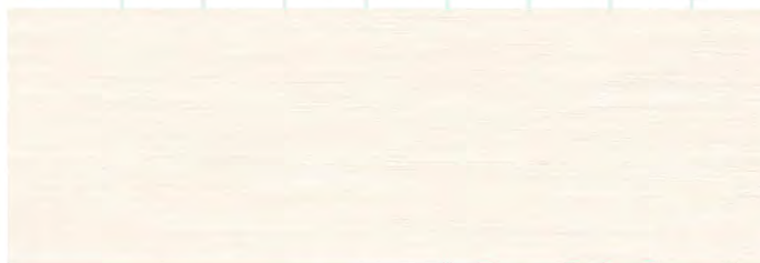
Textile Beige WT15TXL11 Плитка настенная 250x750