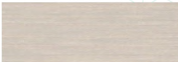
Textile Coffe WT15TXL21 Плитка настенная 250x750