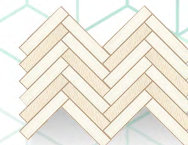
Mosaik Textile Ethereal DW7ERL11 Декор 284x197