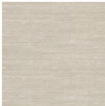
Textile Coffe FT4TXL21 Керамогранит 450x450