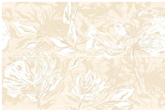
Malory S/2 SW15MAL11 Панно 500x750